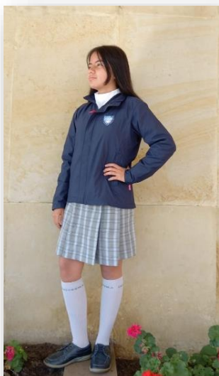
Nueva chaqueta institucional

Mi presencia en el Colegio debe caracterizarse por una excelente presentación personal y porte digno de los uniformes institucionales durante toda la jornada escolar