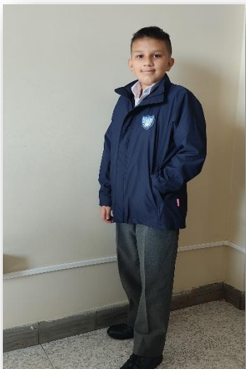
Nueva chaqueta institucional

Mi presencia en el Colegio debe caracterizarse por una excelente presentación personal y porte digno de los uniformes institucionales durante toda la jornada escolar